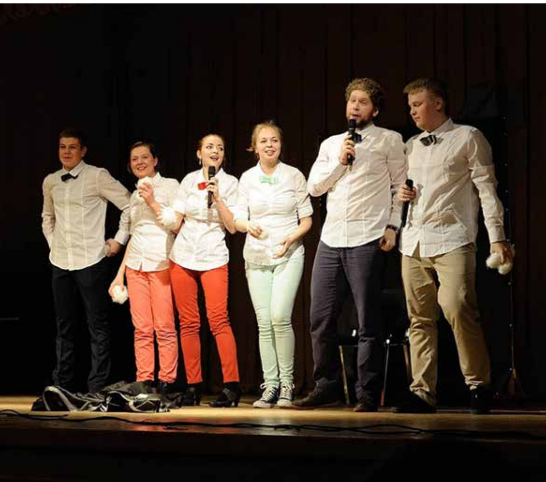
Молодёжный Театр КВН «Ш.Ю.Т.К.А».