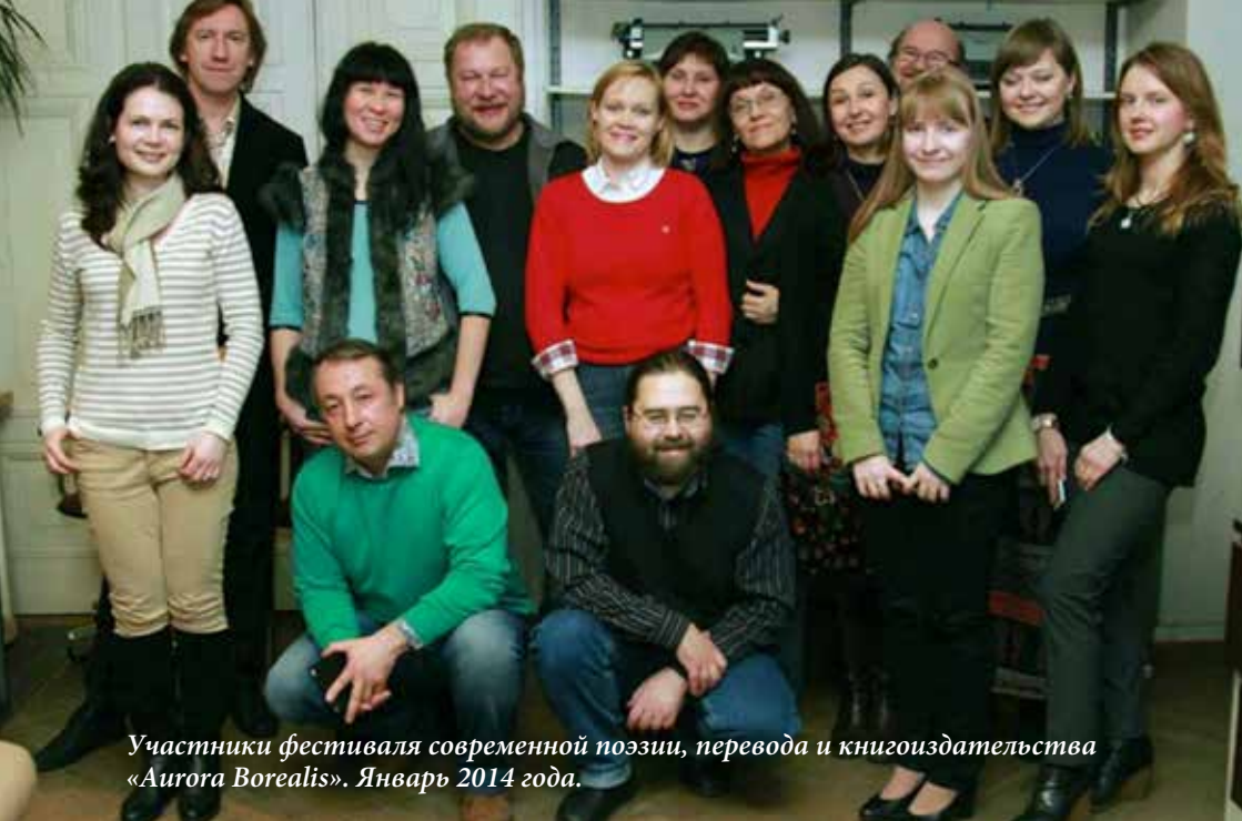
Участники фестиваля современной поэзии, перевода и книгоиздательства «Aurora Borealis». Январь 2014 года.