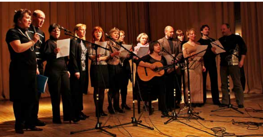
Участники фестиваля бардовской песни.