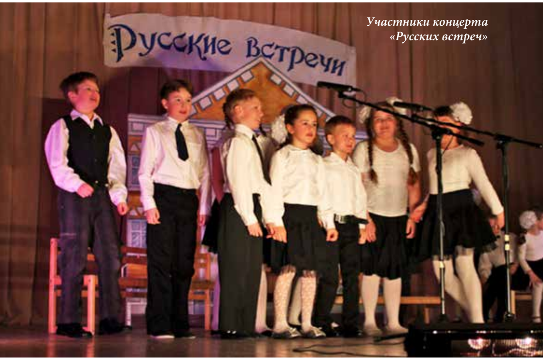
Участники концерта «Русских встреч»