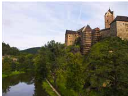
Чешский пейзаж на фотографии Клуба любителей путешествий.