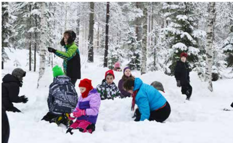
Семейные и детские лагеря клуба «Садко».

Важным делом в «Садко» считается организация отдыха в детских и семейных лагерях. Лагеря устраиваются летом, осенью и зимой. Родители могут выбрать вместе с детьми тот лагерь, где им интересней. У каждого лагеря есть своя тематика и соответственно планируются и мероприятия.