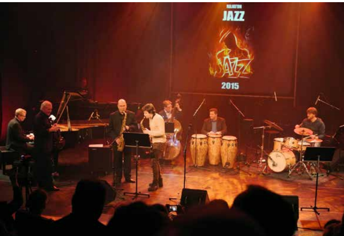
Международный фестиваль «Джаз без границ», 2015 год.